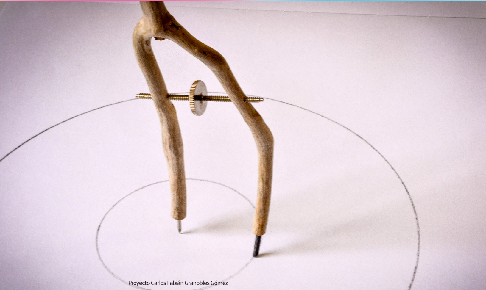
Proyecto Carlos Fabián Granobles Gómez

Inscríbese en: http://app4.utp.edu.co/MatAcad/menu_inscripciones/